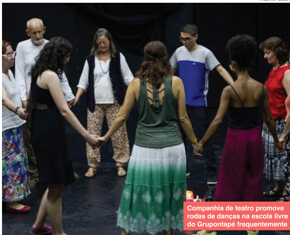
Companhia de teatro promove rodas de danças na escola livre do Grupontapé frequentemente

Atualmente, as danças circulares estão institucionalizadas pela Política Nacional de Práticas Integrativas e Complementares no Sistema Único de Saúde (PNPIC) e