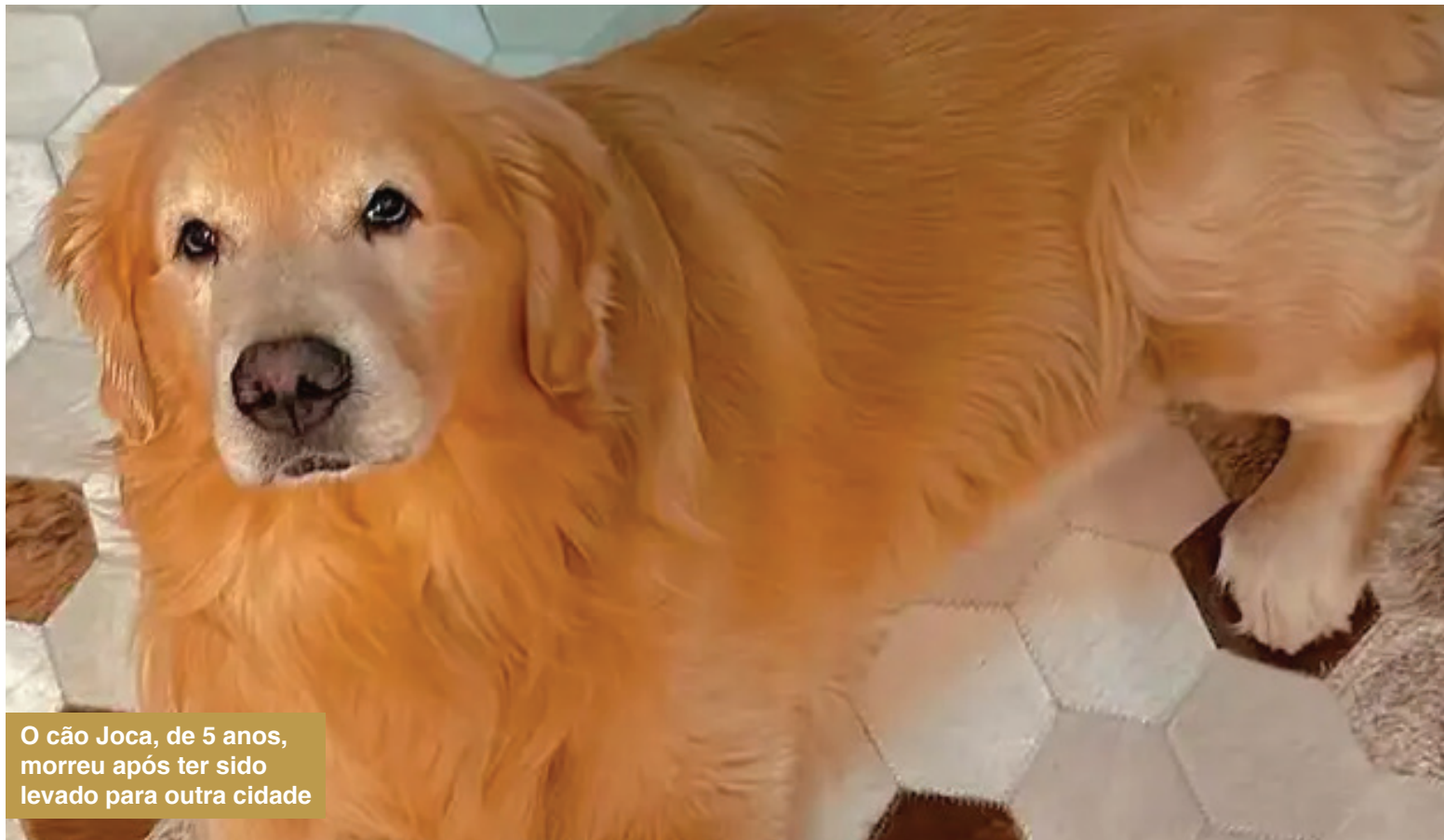
O cão Joca, de 5 anos, morreu após ter sido levado para outra cidade