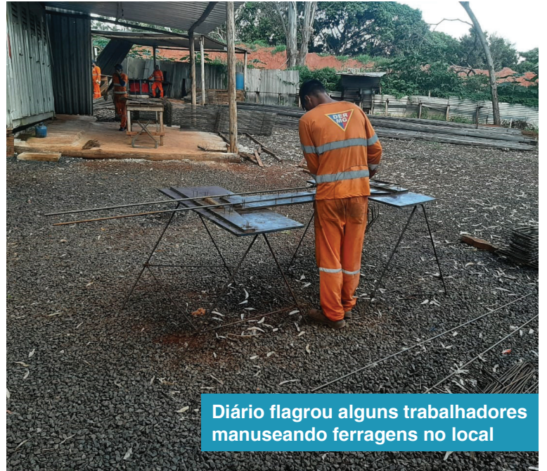
Diário flagrou alguns trabalhadores manuseando ferragens no local

licitações para que outra empreiteira assumisse as obras, reiniciadas apenas em maio de 2022. A estimativa inicial era de que tudo fosse finalizado até o início de 2023. Porém, os trabalhos apenas foram retomados em maio do ano passado.